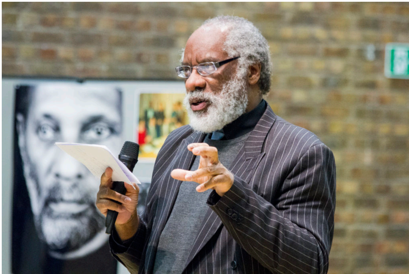
Stuart Hall.

Hall gir to forklaringer på dette som henger sammen. Den første delforklaringen ligger i den synlige forskjellen som rasebegrepet bygger på, sett fra det «hvite», europeiske perspektivet. Rasialiserte forskjeller, argumenterer Hall, er overfladiske trekk ved menneskers utseende, men som allikevel er svært tilgjengelige som signifikanter. Dette betyr at hvilken som helst mening kan knyttes til synlige forskjeller, selv om disse faktisk ikke betyr noe eller har en iboende og naturlig betydning for menneskelige forskjeller. Den andre grunnen til hvorfor rasebegrepet har bestått så lenge, knytter Hall til det han kaller «signifikantkjeder». Disse har, via lange historiske diskurser, ført til at vi som mennesker assosierer visse fordommer om rasialiserte forskjeller mellom folk av forskjellig hudfarge. Dermed er hudfarge og synlige forskjeller viktige for Halls analyse av rasebegrepet som glidende signifikant. Det er verdt å merke seg at det kanskje nettopp er denne delen av boken som vil kunne gi nye perspektiver til norsk forskning på nettopp rasisme og diskriminering. I Norge har man i liten grad vært opptatt av disse aspektene av «rasialiseringprosesser», eller hvordan hudfarge spiller inn i den norske konteksten. Her vil Halls bidrag kunne lede oss frem til nye viktige funn og kanskje enda viktigere, nye og viktige spørsmål.