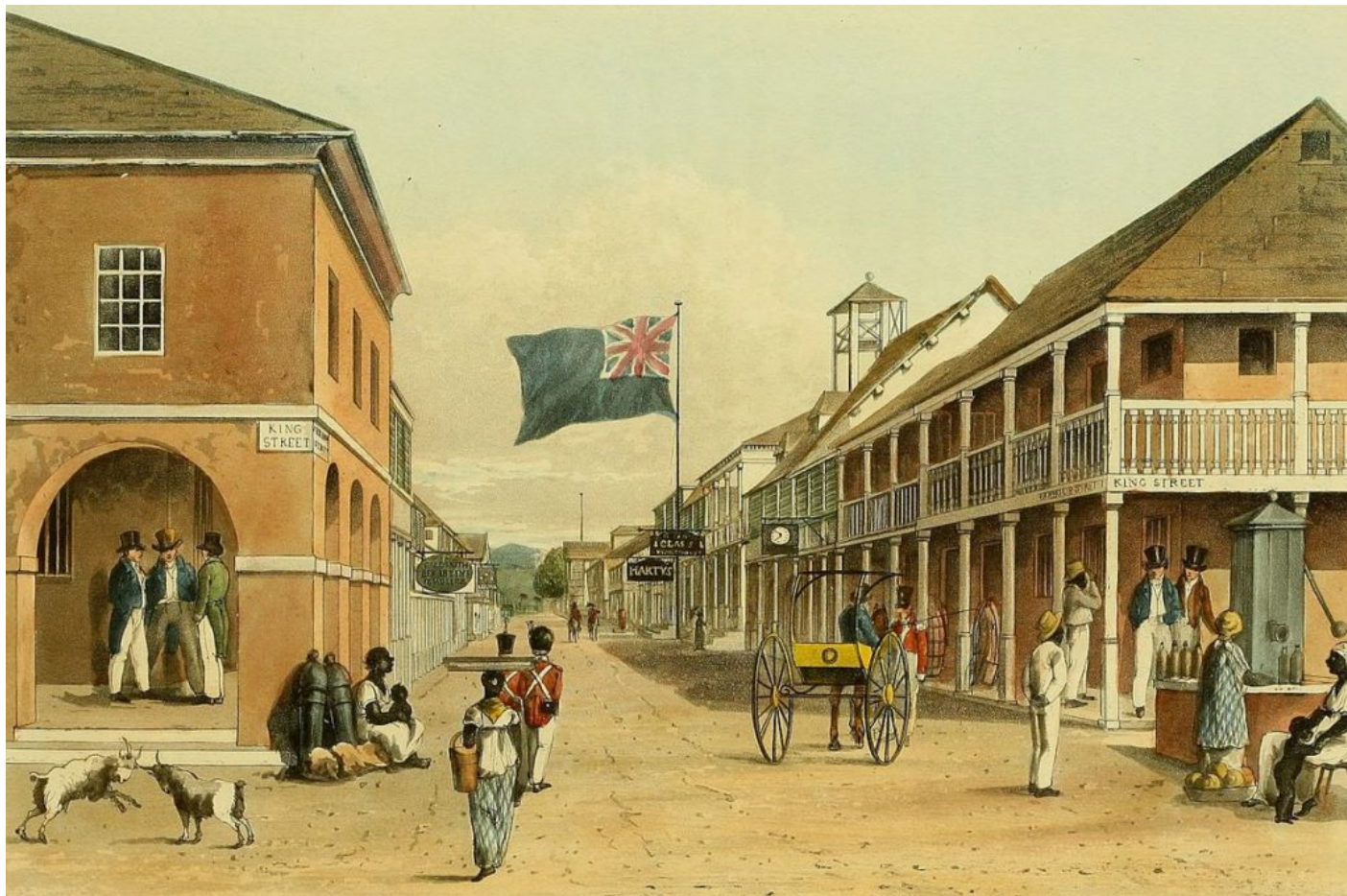
Kingston, Jamaica.