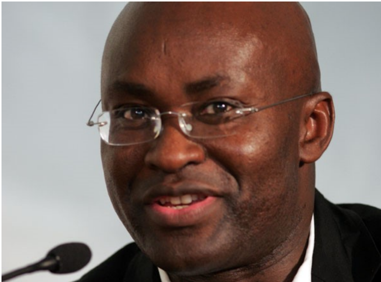
Achille Mbembe

RØFF GUIDE: Sentralt i arbeidene til den afrikanske postkoloniale tenkeren Achille Mbembe står ideen om «å tenke verden fra Afrika». Men Mbembe er også ambivalent til avkoloniseringsbevegelsen, som han mener kan medføre betenkelige former for nativisme og fremmedfrykt.