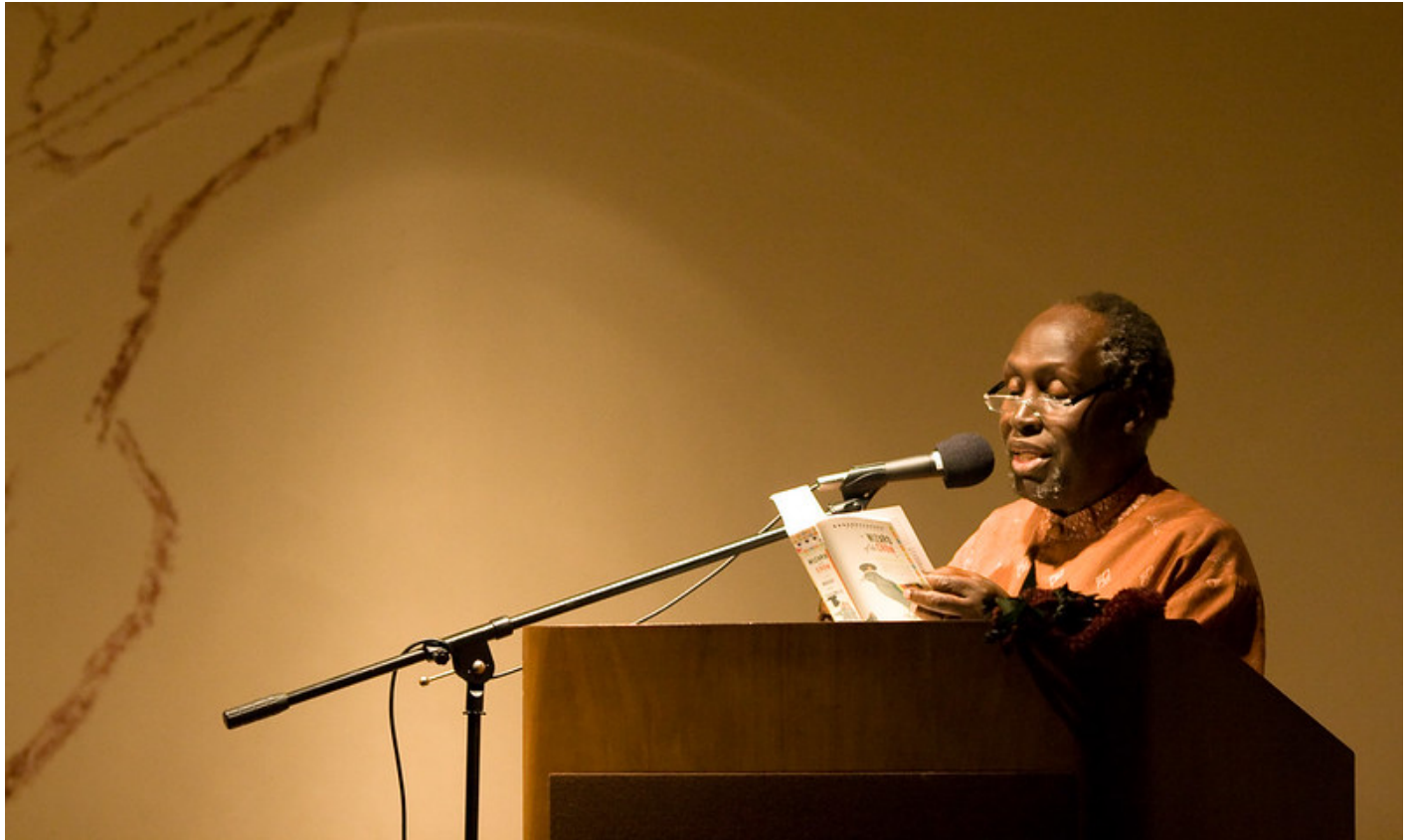
Ngũgĩ wa Thiong'o

Det sier seg i grunn selv at et land som Sør-Afrika, med sine begrensede økonomiske ressurser, umulig vil kunne opprettholde en fungerende litterær sfære for samtlige av de nå elleve offisielle språkene landet har, og tilby undervisning på alle disse språkene ved sine universiteter og høyskoler. Mbembe er også klar på at Afrika og afrikanere ikke kan velge bort sin fortid: Afrika må være et kontinent for alle som faktisk lever og velger å leve der.